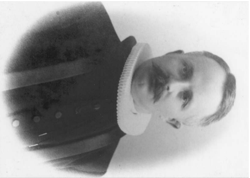
Sokneprest til Gimسøy 1905-12.