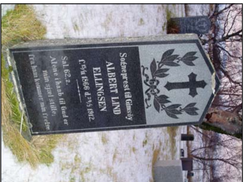
Gravstedet på Gimسøy Gamle.

Det var i Ellingsens tid her i Gimسøy at den berømte storstormen gikk over Lofoten natt til skjærtorsdag 1906 og rev lårnet av Gimسøy kirke slik at presten fant det i fjæra men, uskadet klotke de han kom hjem fra Laukvik.